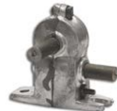
MECANISMO PARA LONA