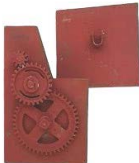
MECANISMO PARA CORTINA