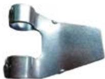
ESLABÓN TERMINAL HEMBRA