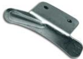
EUROPEA PLANA (IZQ/DER)