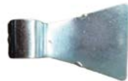
ESLABÓN TERMINAL MACHO