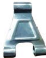
ESLABÓN TUBULAR CENTRAL