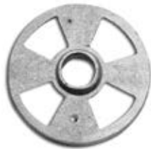
BOMBO DE ALUMINIO