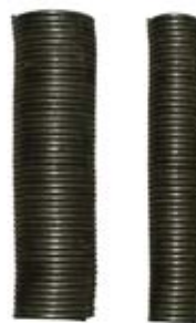
RESORTES PARA CORTINA