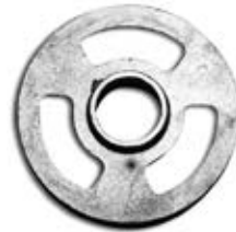
BOMBO DE FIERRO COLADO