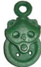
GARRUCHA PARA NORIA