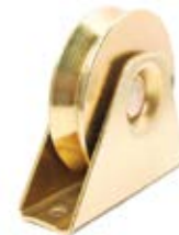
RUEDA CON SOPORTE