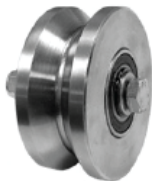
RUEDA P/ANGULO 4", 6"