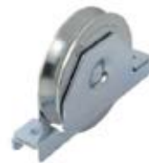
RUEDA CON SOPORTE