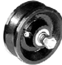
RUEDA P/ANGULO 4"