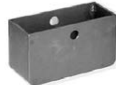
CAJA P/RUEDA 6"