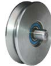
BALERO GUÍA EN V