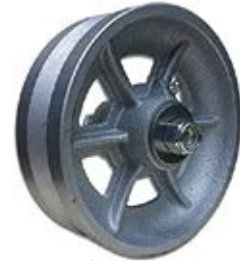
RUEDA P/ANGULO 6"