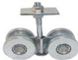
CARRUCHA 9050 EMBALADA