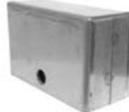
CAJA P/RUEDA 4" (GALV.)