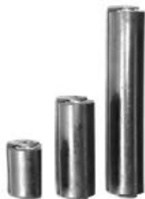
RODILLO DE HULE