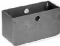
CAJA P/RUEDA 3" y 4"