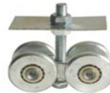
CARRUCHA 9050 EMBALADA