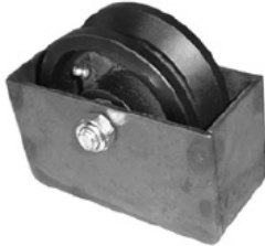
RUEDA P/ANGULO 3"