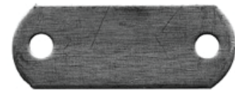
PLACA DOS HOYOS