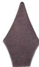
PUNTA TROQUELADA #3