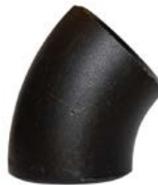
CODO 45 GRADOS