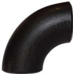
CODO 90 GRADOS