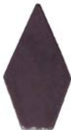
PUNTA TROQUELADA #2